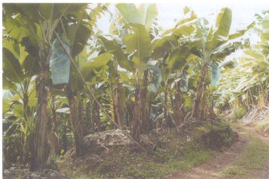
Figura 1. A cultura da bananeira ocupa as áreas de encostas e de maior declividade do Litoral Sul Catarinense

cultivar Branca de Santa Catarina, mas com porte mais baixo e com maior resistência ao tombamento pelo vento. Estima-se que 80% dos bananais na região sejam ocupados com as cultivares Branca e Enxerto, pertencentes ao subgrupo Prata,