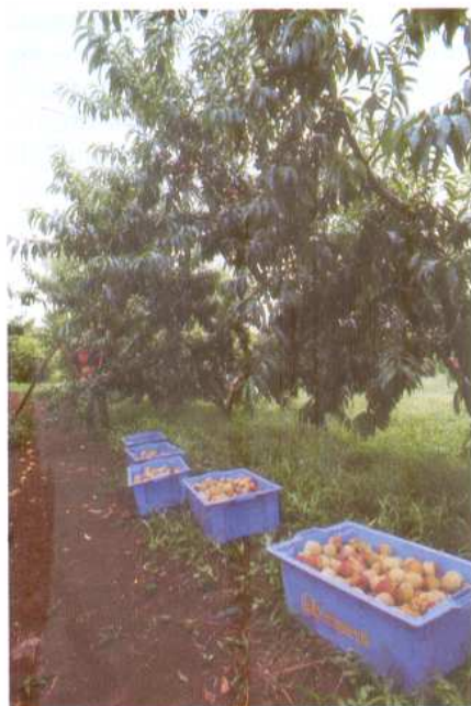
Figura 4. O cultivo do pessegueiro é uma alternativa de fruta de caroço para o Litoral Sul Catarinense

• No caso da ameixa, além da maturação precoce, deve-se buscar cultivares resistentes à escaldadura ( Xylella fastidiosa ) e com frutos de melhor qualidade do que os atuais.