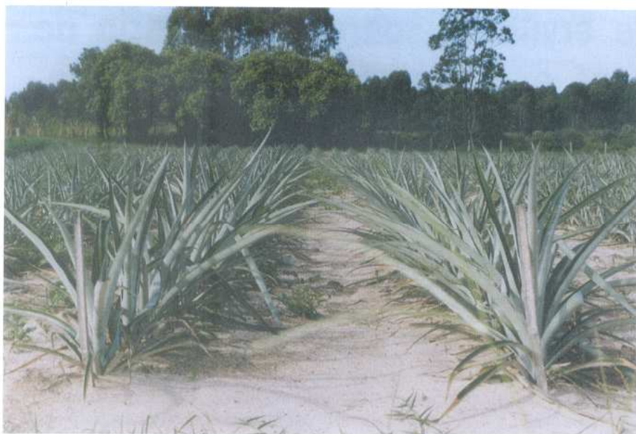
Figura 5. A cultura do abacaxi ocupa áreas de solos arenosos do Litoral Sul Catarinense

mundial e local pela procura de produtos orgânicos, devem ser fomentados trabalhos de pesquisa e de assistência técnica na produção de frutas sem o uso de adubos químicos e agrotóxicos sintéticos. Além disto, o atual sistema produtivo de frutas é extremamente dependente de insumos externos à propriedade e utiliza uma quantidade significativa de produtos químicos.